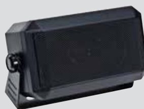
RSN4001 Внешний громкоговоритель 13 Вт