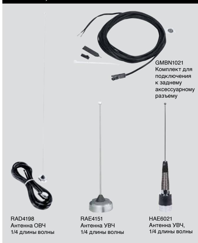
RAD4198 Антенна ОВЧ 1/4 длины волны