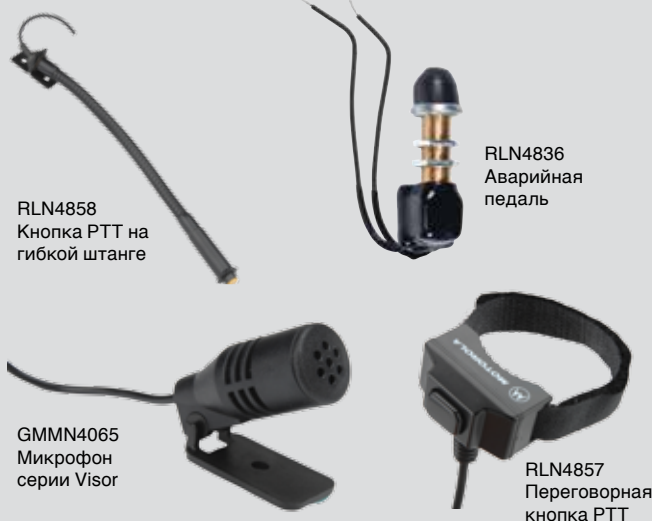
RLN4858 Кнопка РТТ на гибкой штанге