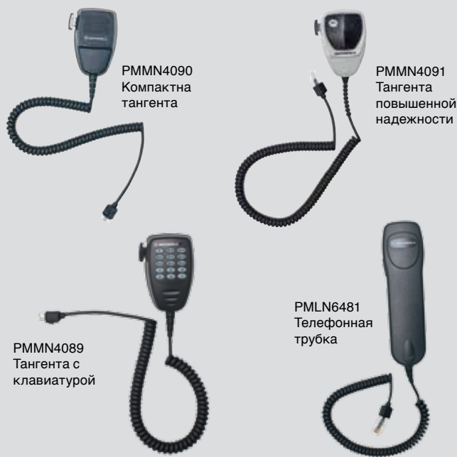
PMMN4090 Компактна тангента